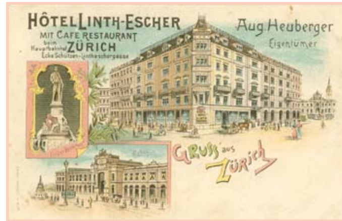
Hotel Linth-Escher um 1900

Der Stadtspaziergang bietet einen kurzweiligen Einblick in Zürichs vielfältige Kaffee-(haus) Kultur. Angelehnt an das Vorbild des von Literaten und Künstlern besuchten «Wiener Kaffeehauses» mit einer beachtlichen Auswahl an Zeitungen oder an das Pariser Boulevardcafé, in welchem «Sehen und Gesehenwerden» erst richtig zelebriert werden konnte, verliehen diese Einrichtungen um 1900 der damals eher beschaulichen Limmatstadt ein grossstädtisches Flair. Für Emigranten wurden die Kaffeehäuser zum wichtigen Treffpunkt, gar zu einer Art Ersatzwohnzimmer, in dem sie viel Zeit verbrachten.