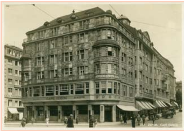
Café Odeon um 1920