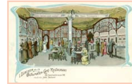
«Automaten Café» um 1900