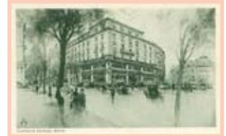
Confiserie Sprüngli o.J.

Keineswegs dem Zeitvertreib dienten indes um 1900 die brandneuen, sogenannten Automatencafés. Sie sollten dem gehetzten Geschäftsmann an der Bahnhofstrasse zu einer raschen Kaffeinzufuhr verhelfen. Es scheint aber, dass die Zeit für solch gastronomische Innovationen noch nicht reif war. Nach wenigen Jahren verschwanden die Automatencafés nämlich wieder von der Bildfläche. Fast 100 Jahre sollte es dauern, bis die Kaffeautomaten auf Bahnhöfen und die beigefarbenen Pappbecher für den schnellen Kaffee zum Mitnehmen das städtische Bild zu prägen begannen.