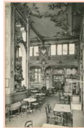
Café Metropol 1923