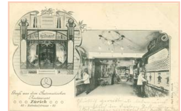
«Automatisches Restaurant» 1902

Keineswegs dem Zeitvertreib dienten indes um 1900 die brandneuen, sogenannten Automatencafés. Sie sollten dem gehetzten Geschäftsmann an der Bahnhofstrasse zu einer raschen Kaffeinzufuhr verhelfen. Es scheint aber, dass die Zeit für solch gastronomische Innovationen noch nicht reif war. Nach wenigen Jahren verschwanden die Automatencafés nämlich wieder von der Bildfläche. Fast 100 Jahre sollte es dauern, bis die Kaffeautomaten auf Bahnhöfen und die beigefarbenen Pappbecher für den schnellen Kaffee zum Mitnehmen das städtische Bild zu prägen begannen.