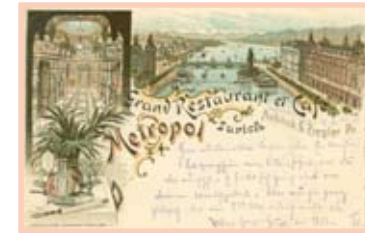
Café Metropol 1896